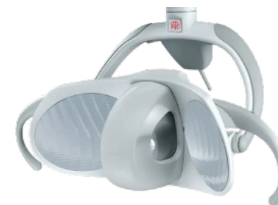
FARO - MAIA