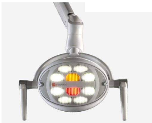
GCOMM - POLARIS