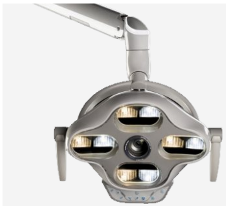
GCOMM - IRIS