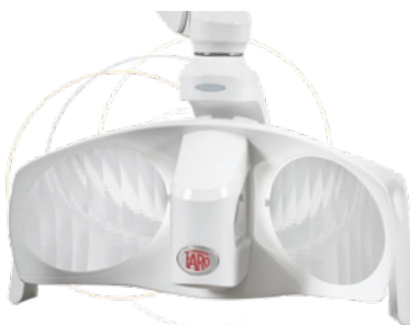
FARO - EVA